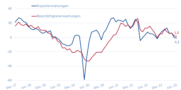
Export- und Beschäftigterwartungen METALL NRW