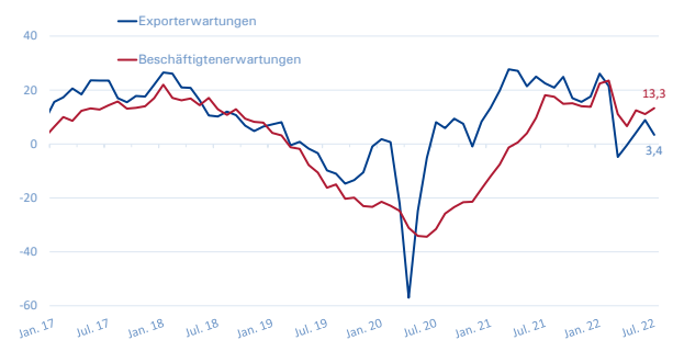
Export- und Beschäftigterwartungen METALL NRW