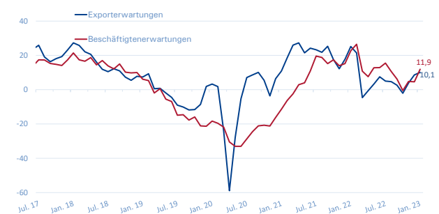
Export- und Beschäftigterwartungen METALL NRW