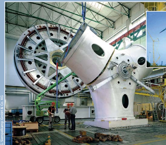
Energie- und Umwelttechnologie

Diese Vielfalt zeigt schon: Der Maschinenbau ist eine große und wichtige Branche in der deutschen Wirtschaft. Viele, viele kleine und mittlere Maschinenbau-Betriebe stellen zusammen die meisten Industriearbeitsplätze in Deutschland. Da sie mehr als 70 Prozent ihrer Produkte in andere Länder verkaufen, verhelpfen sie Deutschland seit Jahren zum Titel „Exportweltmeister“.