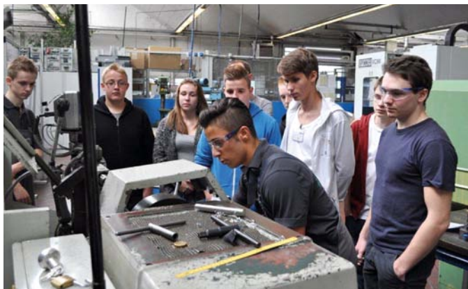
WILLO SE, Dortmund

was Du später machen willst – Ausbildung, Studium, Beruf... ?