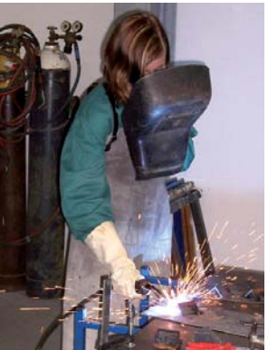
PlatTeG GmbH, Siegen

In ganz Nordrhein-Westfalen. Informationen über die Unternehmen/Standorte gibt es unter www.erlebnis-maschinenbau.de